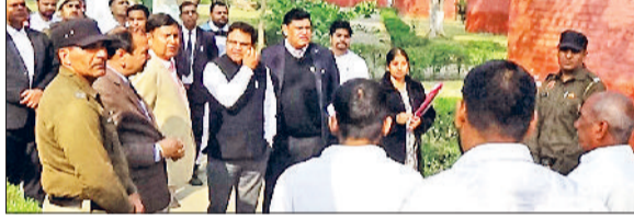
जिला कारागार में निरीक्षण करते हुए सत्र न्यायाधीश।