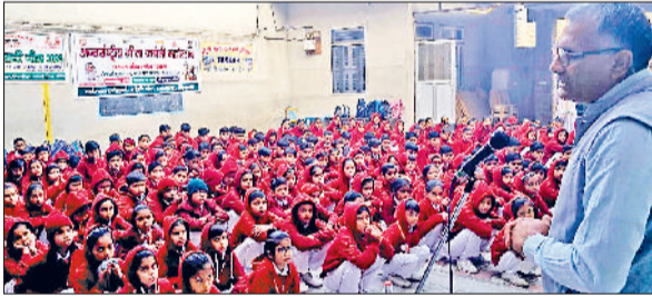
भिवानी। गीता महोत्सव के उपलक्ष्य में आयोजित कार्यक्रम में उपस्थित विद्यार्थी।

अंतर्राष्ट्रीय गीता जयंती महोत्सव के अवसर पर सामाजिक संस्था नेताजी सुभाष चंद्र बोस युवा जागृत सेवा समिति, सदाचारी शिक्षा समिति, श्री कृष्ण कृपा परिवार तथा जिओ गीता के संयुक्त तत्वावधान में विवेकानंद हाई स्कूल में ट्रेन विद्यार्थियों द्वारा विशेष गीता पाठ आयोजित किया। 700 विद्यार्थियों ने एक साथ तीन श्लोकों का उच्चारण कर पूरे वातावरण को आध्यात्मिक ऊर्जा से भर दिया। यह कार्यक्रम अंतर्राष्ट्रीय स्तर पर होने वाले 1 दिसंबर को सुबह 11:00 बजे एक साथ गीता पाठ अभियान का संदेश प्रसारित करने के उद्देश्य से आयोजित किया गया।