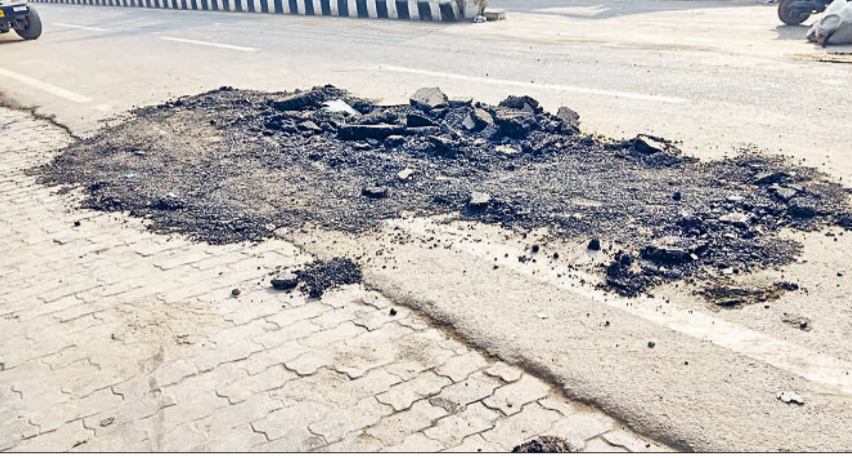
बवानीखेड़ा के जनस्वास्थ्य एवं अभियांत्रिकी विभाग द्वारा सड़क के नीचे से सीवरेज लाइन को निकाला जा रहा।