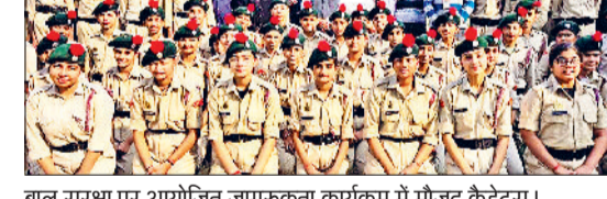
बाल सुरक्षा पर आयोजित जागरूकता कार्यक्रम में मौजूद कैडेट्स।