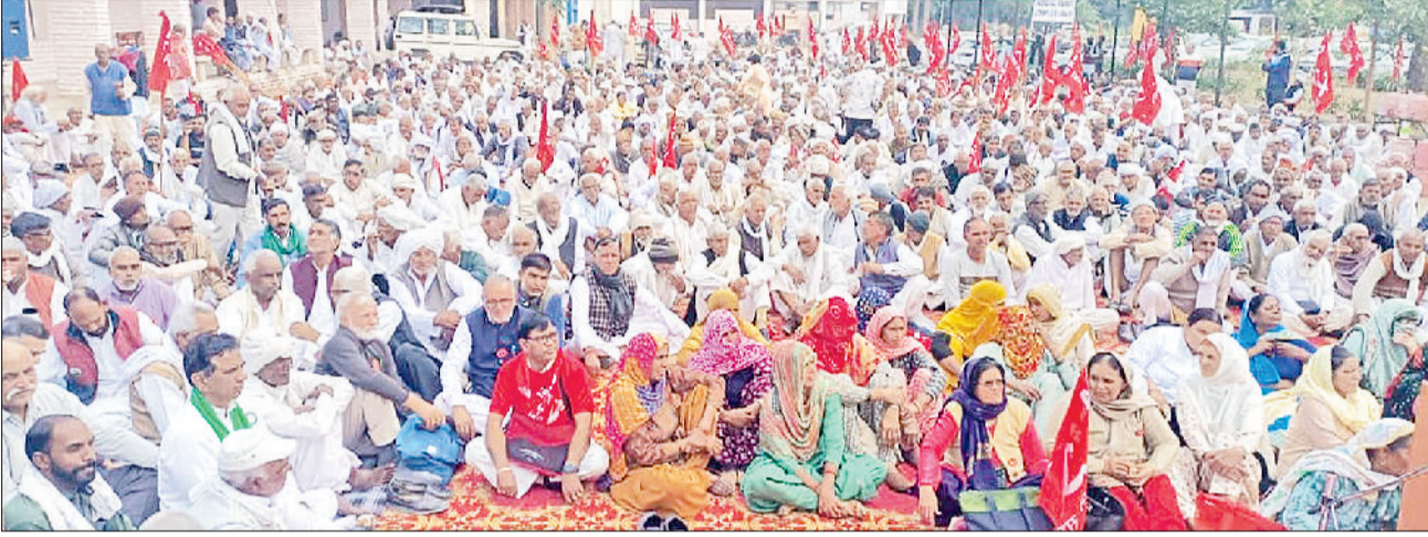
हरिभूमि न्यूज ॥ लोहारू

लोहारू। एसडीएम कार्यालय के बाहर आयोजित महापंचायत में उपस्थित किसान नेता व विभिन्न गांवों के ग्रामीण।