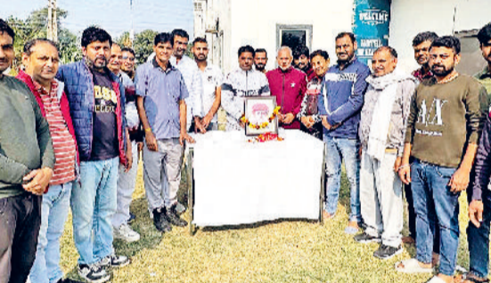
मिवानी। ज्योतिबा फुले के चित्र पर पुष्प अर्पित करते हुए।