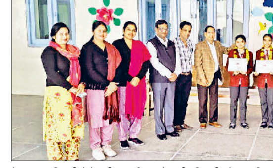
वैश्य स्कूल भिवानी में बेहतरीन प्रदर्शन करने वाली प्रतिभागी को सम्मानित करते हुए।